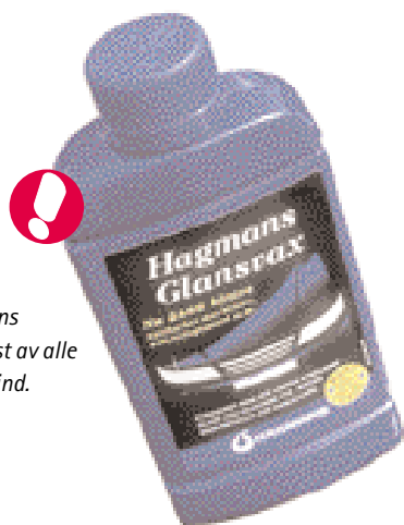
Best i test og bra kjøp: Hagmans Glanswax beholdt glansen best av alle gjennom et halvt år i vær og vind.