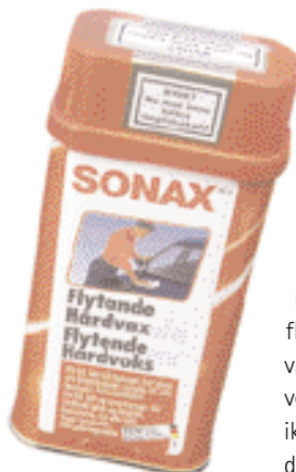
Sonax Flytende Hardvoks var det eneste middelet som ikke klarte denne delen av testen.

Ble mørkere: Brilliant Wax, Turtle Wax Original kremvoks, Simoniz Liquid Diamond, Eagle One Wet Polish Et Wax, Sonax Xtreme Wax, Hagmans Glanswax og Sonax Flytende Hardvoks.