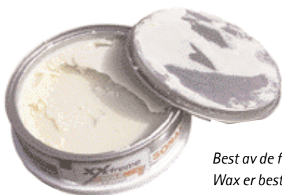
Best av de faste: Sonax Xtreme Wax er best av de faste voksene, som er litt tyngre å arbeide med.